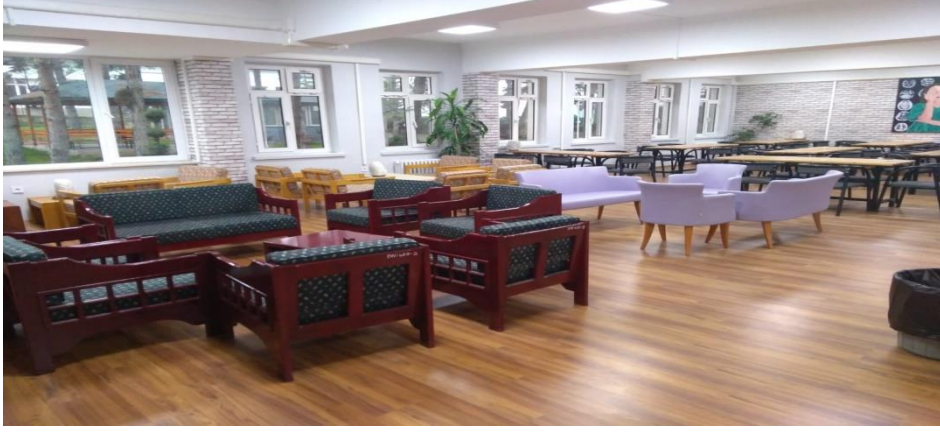
Fakültemiz Bahçesi, Öğrenci Dinlenme Alanı ile Kütüphanesinden Birkaç Kesit.