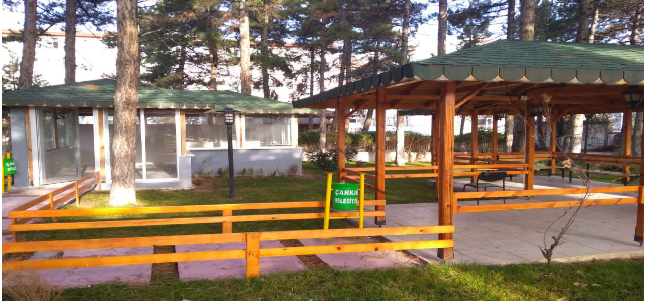
Fakültemizde açılacak olan Kantinden Bir Kesit.

2019-2020 Eğitim-öğretim yılı yaz döneminde Fakültemize yeni Bölümlerin açılması ve öğrenci alımı nedeniyle Fakültemiz binası köklü bir bakım ve onarımdan geçmiştir. Sınıf sayıları ve kapasiteleri artırılmış, yeni laboratuvarlar oluşturulmuş, öğrenci dinlenme alanları ile yemekhane kapasiteleri artırılmıştır. Fakültemizde açılması planlanan kantin tamamlanmıştır..