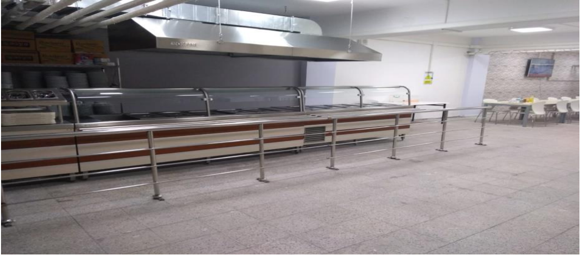
Fakültemiz Yemekhanesinden Bir Kesit.

Öğrenci ve Personel Yemekhane Kapasitesi: 210 Kişi