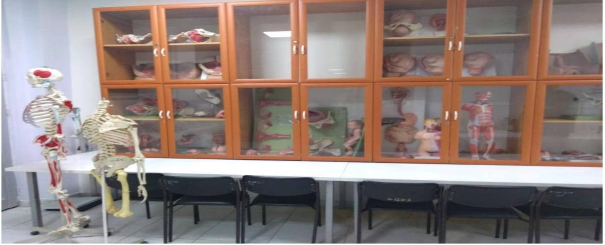
Fakültemizde Yer Alan Laboratuvarlar ile Ambulanstan Birkaç Kesit.