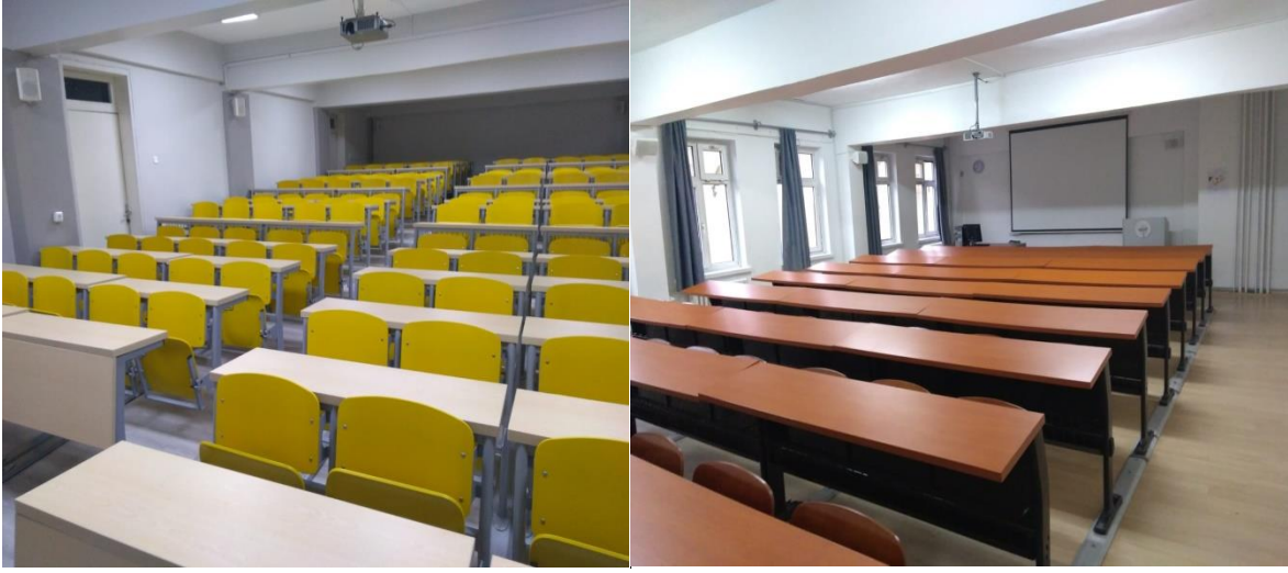
Fakültemizde Yer Alan Dersliklerden Bir Kesit.