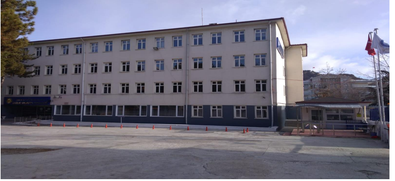
Fakültemiz Hizmet Binasından Bir Kesit.

f. Tüm sağlık hizmetlerinin temel amacı olan sağlık hizmetlerine ulaşılabilirliği ve bu hizmetlerden eşit yararlanmayı artıracak, sağlık hizmetlerine öncelik vererek kişilerin yaşam kalitesini ve hayat standartlarını yükseltmektir.