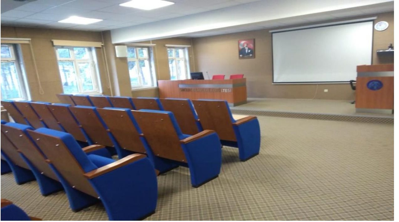
Fakültemiz Konferans Salonundan Bir Kesit.